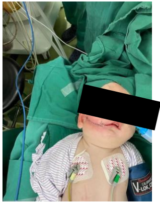
图四，术后修复效果